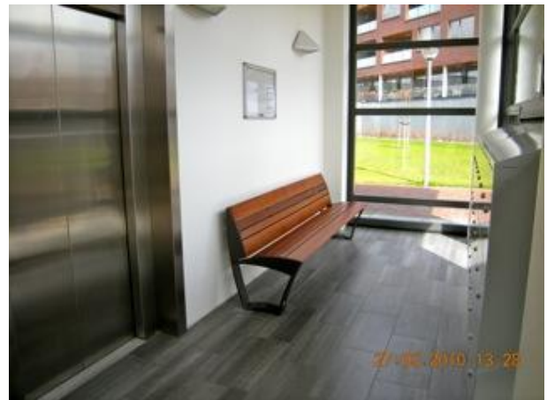
Entree woontoren Leliepark

Huurcommissie Postbus 16495 2500 BL DEN HAAG