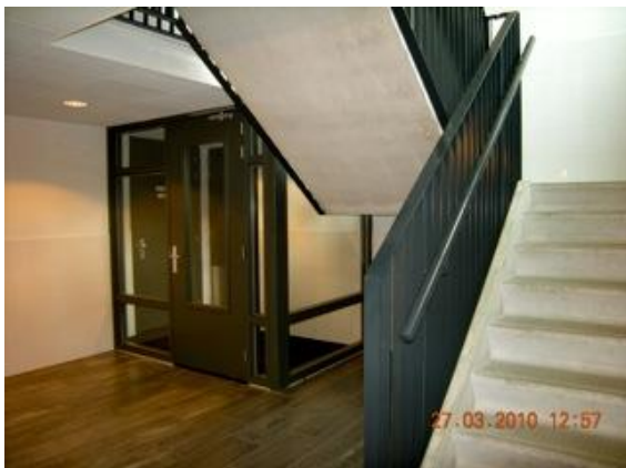
Entree woonblok Leliepark

De huurdersvereniging hoopt met de onderhandelingen te bereiken dat er aan dit soort zaken wat gedaan wordt. Het nieuwe Sociaal Statuut is nog niet gereed, maar de voorzitter hoopt dat er binnenkort getekend kan gaan worden. Het nieuwe Sociaal Statuut is dan geldig tot 2014.