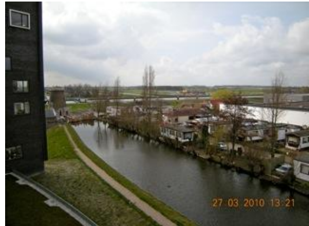
Uitzicht vanaf woontoren Leliepark

De huurdersvereniging zoekt een aantal mensen die genegen zijn vier maal per jaar de nieuwsbrief in hun wijk te bezorgen, uiteraard tegen vergoeding. De nieuwsbrief wordt dan bij u aangeleverd in enveloppe met adres, dus het enige dat u nog hoeft te doen is deze in de bus te doen in uw buurt. Interesse? Stuur een e-mail naar het secretariaat van de huurdersvereniging of stuur een briefje, dan nemen wij contact met u op voor verdere informatie.