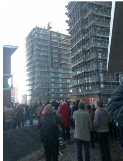
Bereiken hoogste punt Uiverplein