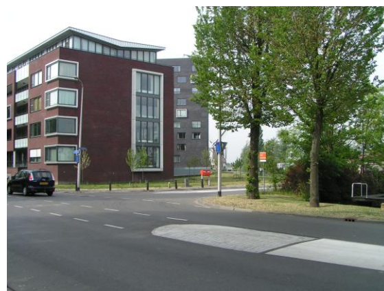
Bewonerscommissie Leliepark Korte- Akkeren

Ook bemiddelen wij voor u als u er niet meer uitkomt met uw verhuurder. Wij kunnen u terzijde staan bij eventuele problemen op gebied van woongenot, woning enz. Wij vragen u om begunstiger (lid) te worden van HWHM. De contributie is slechts € 0,45 per maand. Dit wordt automatisch geïncasseerd via uw servicekosten. U kunt zich aanmelden per e-mail info@hwhm.nl of gebruik de aanmeldingsbon. Met vriendelijke groet, Stichting HWHM.