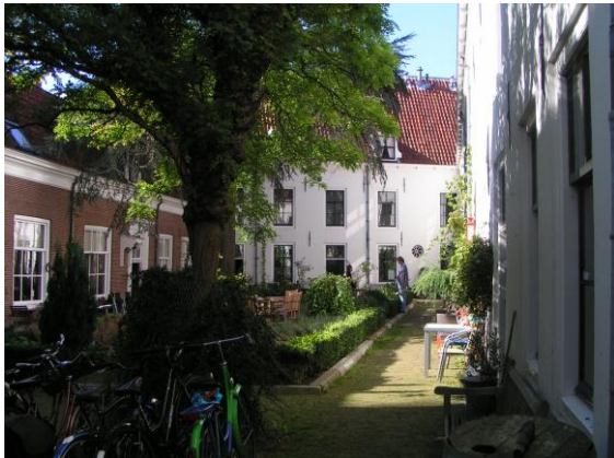
Bewonerscommissie Willem Vroesenplein Gouda.