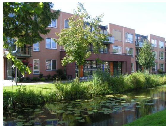
Bewonerscommissie Groen van Prinstersingel

Complex 833, Burg. Gaarlandtsingel e.o. Het Groot Onderhoud van dit complex bevindt zich in de voorbereidende fase voor uitvoering. Naar verwachting zal in het 4e kwartaal 2011 met de werkzaamheden worden gestart. De 76 woningen zijn verdeeld over vier blokken met gestapelde woningen en vier eengezinswoningen. De woningen zijn begin jaren '50.